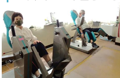
下肢を鍛える機器

新しい機器で皆さんが頑張っている姿を見に、ぜひ、リハビリ室をのぞいてみてくださいね。