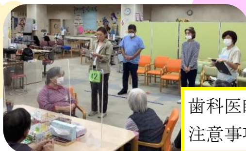
歯科医師による 注意事項