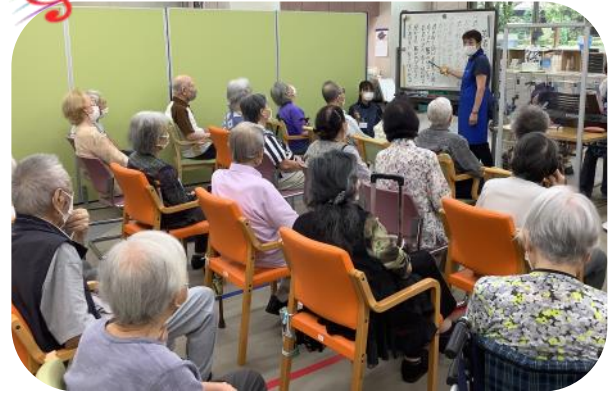
この日の歌は「若者たち」♪