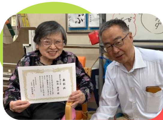
一文字コンテスト 「味わい深いで賞」受賞！ おめでとうございます♪