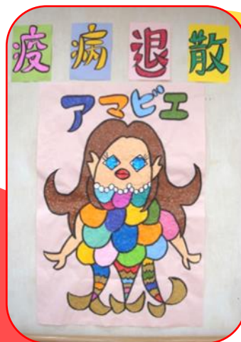
自慢のレク・クラフト 入選！ 貼り絵作品「アマビエ」