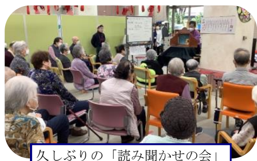
久しぶりの「読み聞かせの会」

こどもの日 「端午の節句御膳」と墨田区浴場組合からいただいた菖蒲で入浴を楽しみました