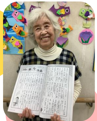
俳句部門受賞！ おめでとうございます♪