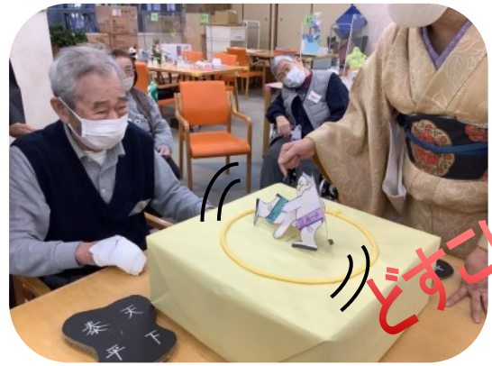
新春うめわか場所