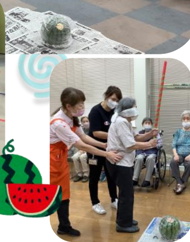
墨田児童会館の子供達とスイカ割り♪