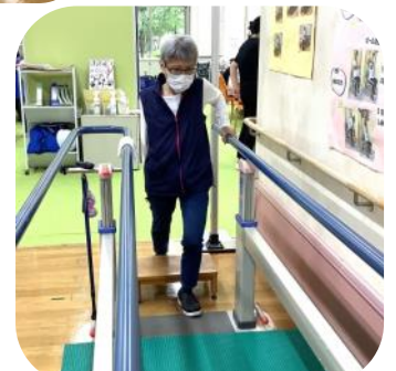
しっかり足を踏出して