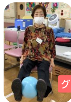
グツと持ち上げて～