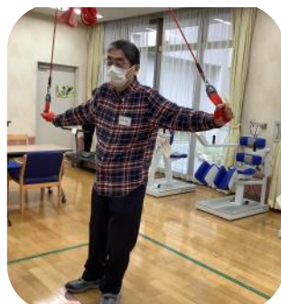
人気のレッドコード♪