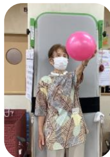
しっかりつかんで～